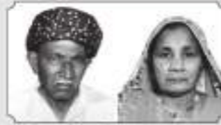
માતૃ શ્રી સમ્ભવેલ દેસર લલા ગડા (મતડરા)