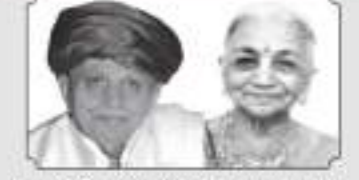
માતૃ શ્રી વેળુબેલ પોપટલાલ અરજાણ ગડા હરો, અ.સી. દમલકીબેલ સ્મૃતીકા ગડા (લાકડીયા)