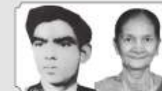
માતૃ શ્રી ધરબેલ કાલજી ખેરાવ ગડા (લાકડીયા)